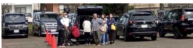
写真2. 入庫状況(ベビーカーも出し入れしやすい広めの駐車間隔)