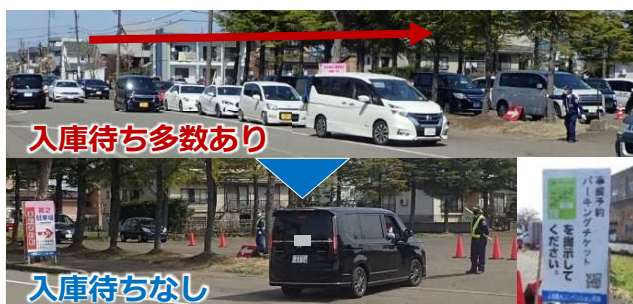
写真1. 例年との入庫待ち状況の違い