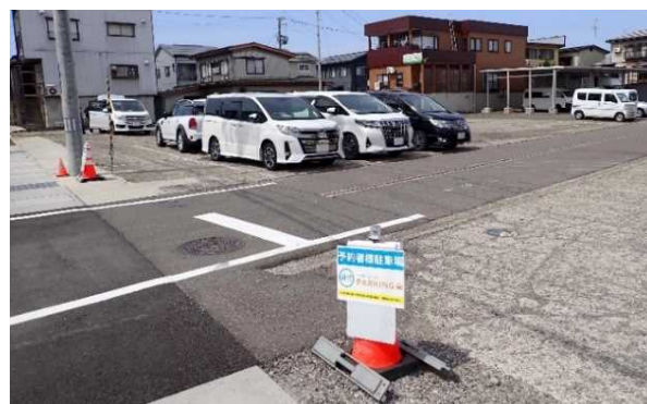
写真3. 予約駐車場の表示と、入庫状況