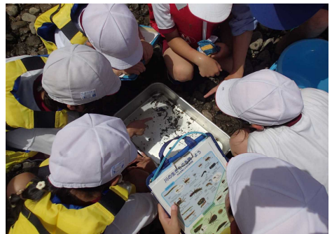
採集した水生生物を判定