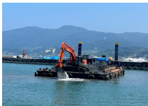
輪島港漁船だまり③浚渫状況 (6月14日)