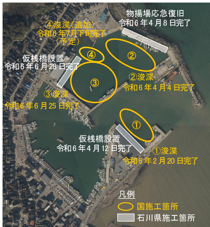
輪島港漁船だまり浚渫・仮棧橋設置等工程