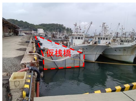
輪島港漁船だまり①現況 (6月25日)