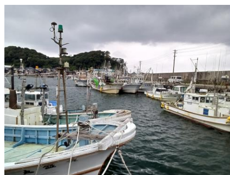
輪島港漁船だまり②現況 (6月25日)