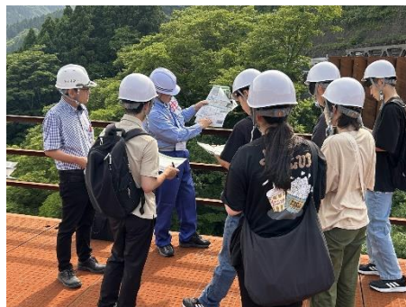
国道41号猪谷楡原道路(片掛・猪谷)