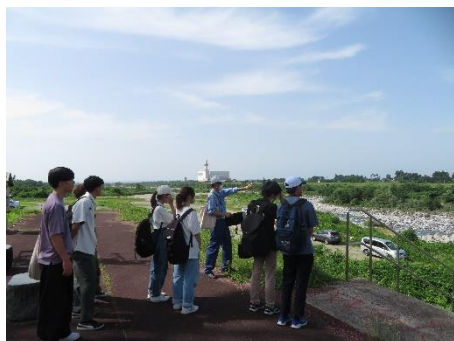
常願寺川(富山市上滝地区)