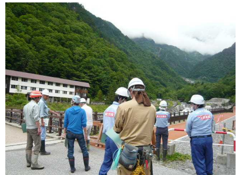
前回（夏休み前）点検の実施状況