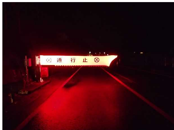
◆交通遮断機の展開状況