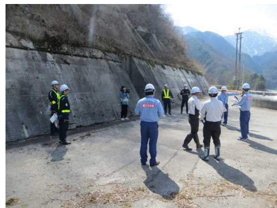
令和6年GW前安全利用点検状況