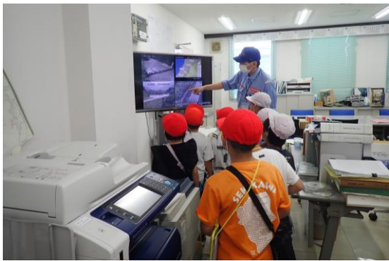
【参考】関川砂防出張所の説明

関川砂防出張所のすぐそばにある、関川小学校2年生のみなさんが、「村のすてき調査隊」として見学にやってきます。出張所の中はどうなっているのか、どんなお仕事をしているのか、ぜひ調査していただきたいと考えています。 また、飯豊山系砂防事務所の職員が、国土交通省の砂防事業や土砂災害などについて、パネルや土石流模型実験装置などを用いた説明も行います。 雨の多い時期を迎えましたので、児童のみなさんにも取り組んでほしい、災害への備えについてもお話しします。 日時： 令和6年6月13日（木）10：30～11：15（予定） 場所： 飯豊山系砂防事務所 関川砂防出張所（関川村大字上関1303-2） 対象： 関川村立関川小学校2年生 児童26名 ※「村のすてき調査隊」は、生活科「村探検」授業の一環と聞いています。 詳細については関川小学校へお問い合わせ願います。