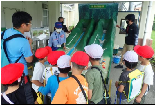
【参考】土石流模型実験装置による説明

※発熱などの症状がある方は来場をお控えください。 ※天候によっては、当日急遽中止となる可能性もございます。予めご了承ください。