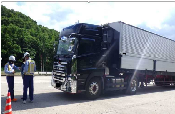
許可書確認の様子