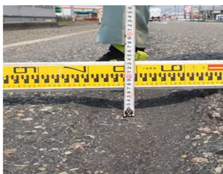
舗装のわだち掘れ