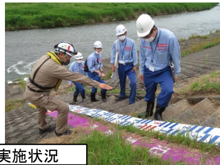
昨年度の点検実施状況