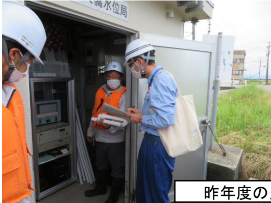
昨年度の点検実施状況