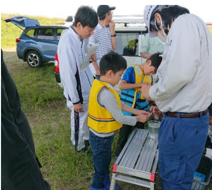
令和5年「小矢部川水質調査」の様子