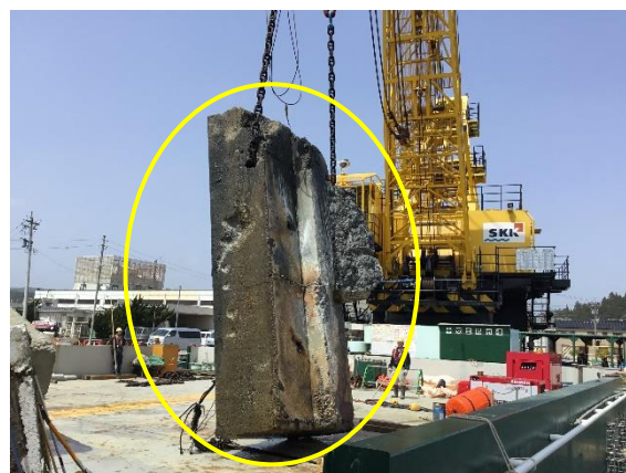
防波堤コンクリート類