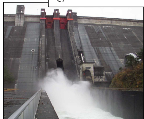
ダムからの放流時の様子