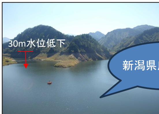
貯水位を下げた おおいし湖