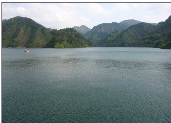
貯水位を下げ前の おおいし湖

これからの梅雨や台風シーズン等に備え、大雨により発生する洪水を貯め込むための容量(洪水調節容量)を確保しておくため、5月29日から6月15日にかけて、ダム貯水池(おおいし湖)の水位を約25m低下させます。これにより、新潟県庁約94杯分(1,750万m 3 )の容量を確保します。