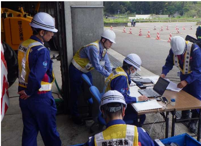
特殊車両通行許可証の確認をしています。