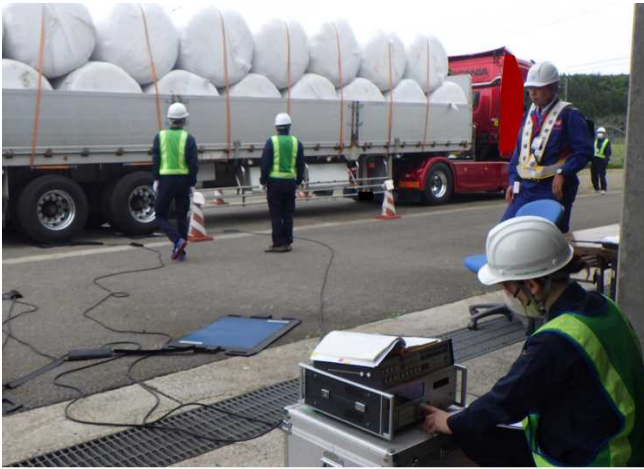
車両の重量を計測しています。