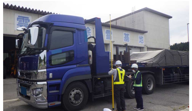
車両の寸法を計測しています。