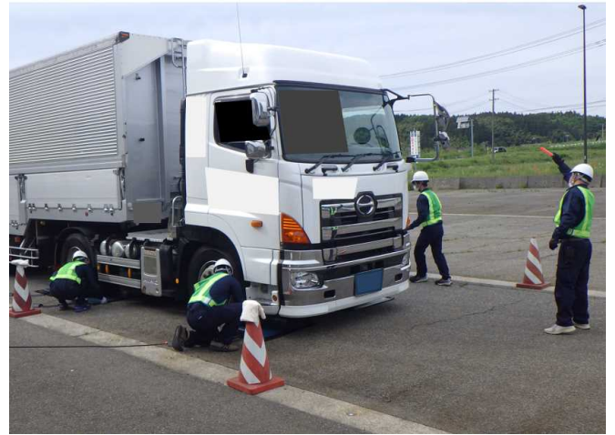
車両の重量を計測しています。