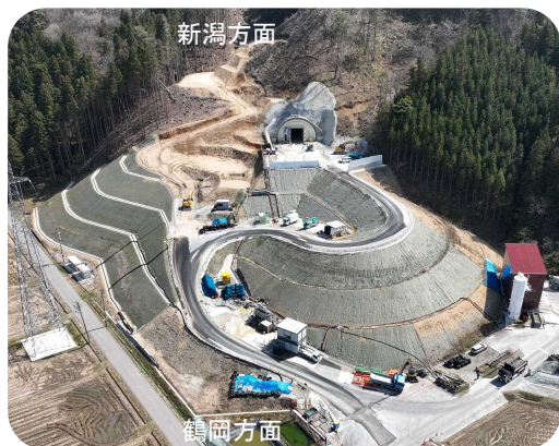
【終点側掘削開始地点(村上市立島地先)】