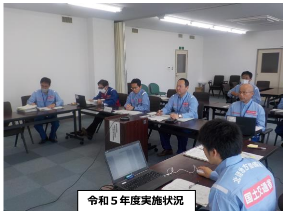
令和5年度実施状況