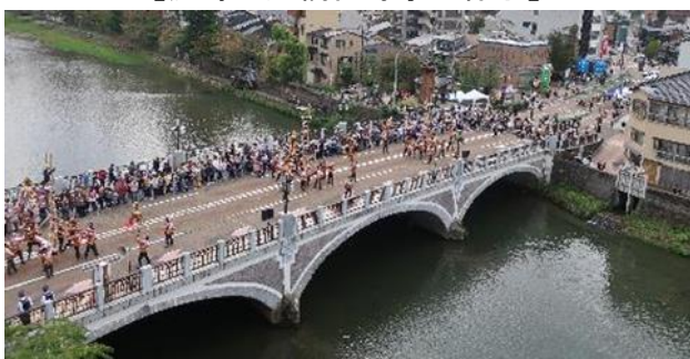
【浅野川大橋 橋みがぎの様子】