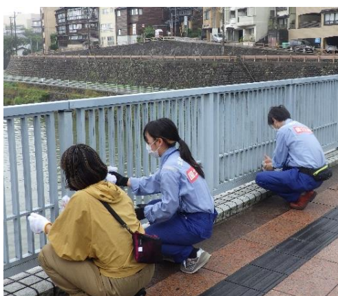
【犀川大橋 橋みがぎの様子】