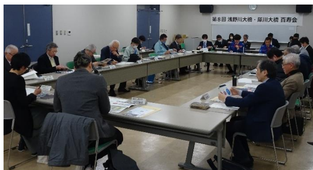
【第8回百寿会の様子】