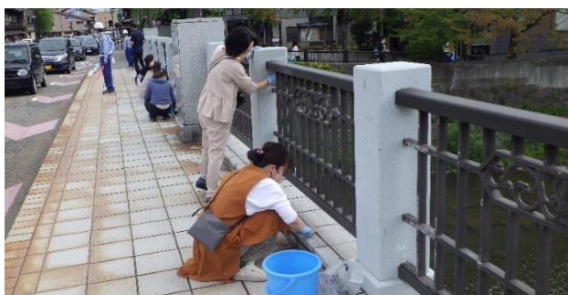
【浅野川大橋 橋みがぎの様子】