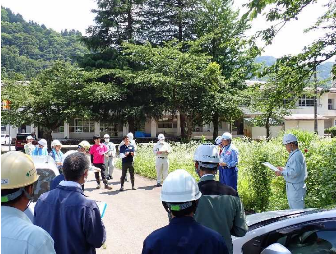
参加者24名での点検箇所・項目の確認 (常願寺川水辺の楽校)