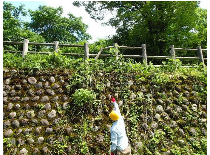
安全利用点検を行う参加者 (常願寺川水辺の楽校)