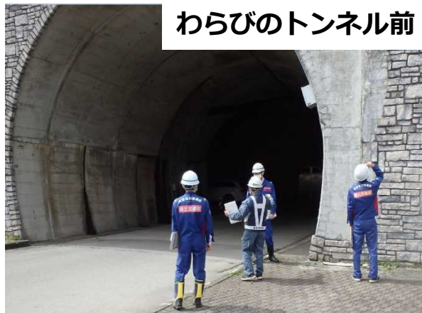
わらびのトンネル前