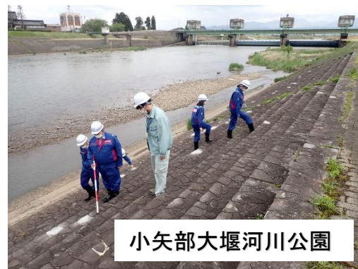
小矢部大堰河川公園