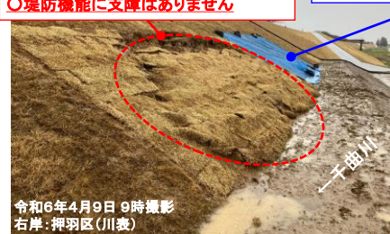
令和6年4月9日 9時撮影 右岸: 押羽区(川裏)

○川側の護岸表面に実施した覆土の一部に変状(亀裂)を確認 ○堤防機能に支障はありません