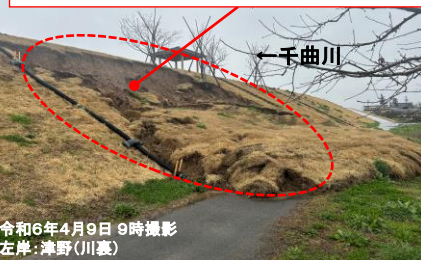
令和6年4月9日 9時撮影 左岸: 津野(川裏)

○川側の護岸表面に実施した覆土の一部に変状(亀裂)を確認 ○堤防機能に支障はありません