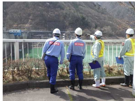
令和5年安全利用点検状況