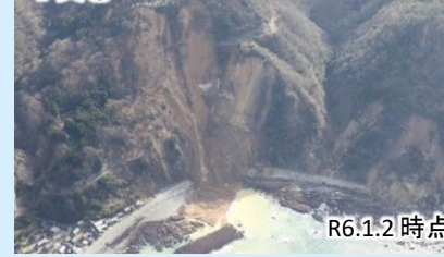
写真③ 国道249号法面崩落