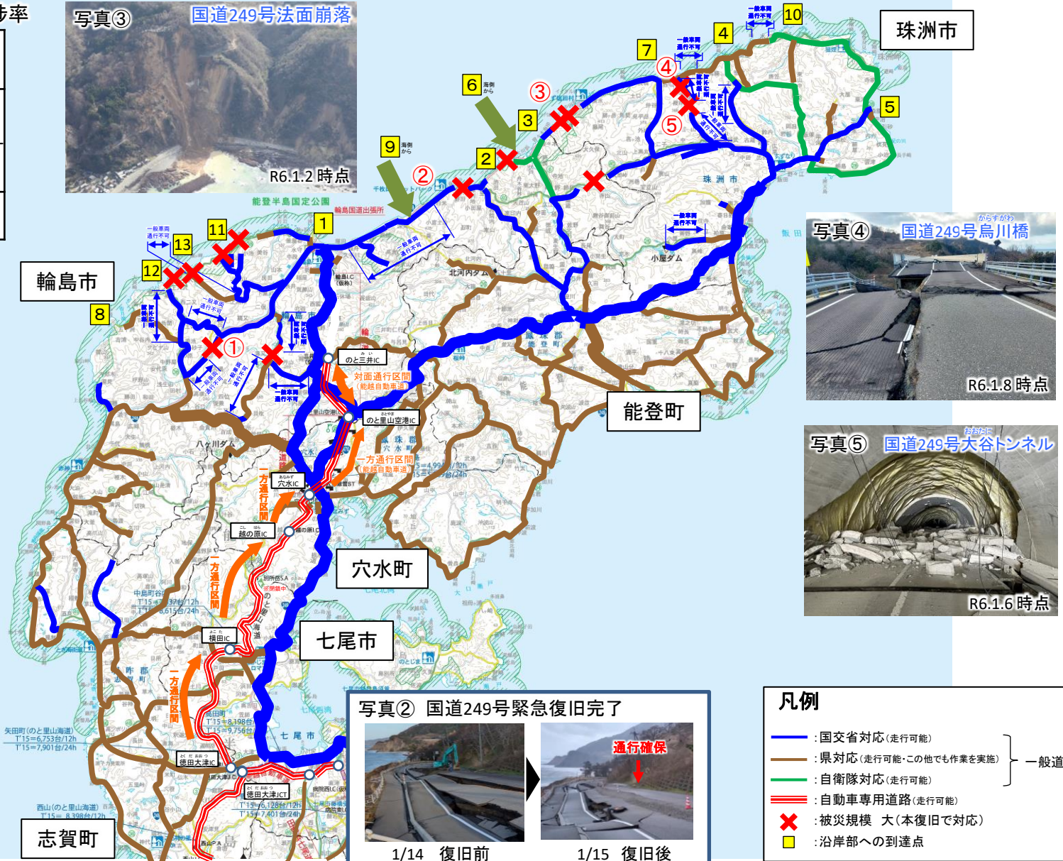
写真④ 国道249号鳥川橋