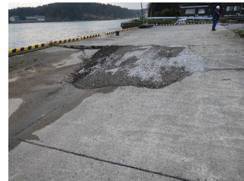
物揚場背後の沈下