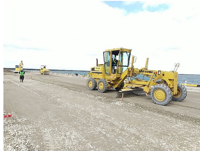
③路盤材敷均し状況(R6.2/26(月)撮影)