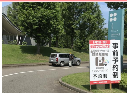
長岡花火 公式駐車場