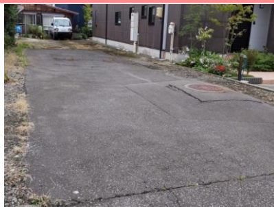
柏崎花火 徒歩15分 5,000円/1台