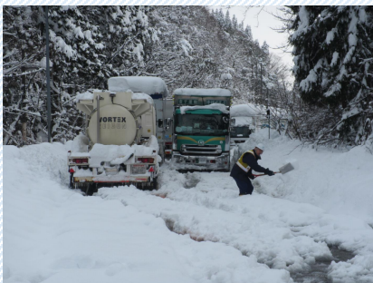
H30. 2. 6