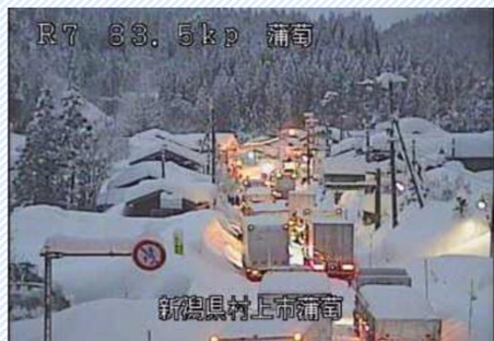
H30. 2. 6