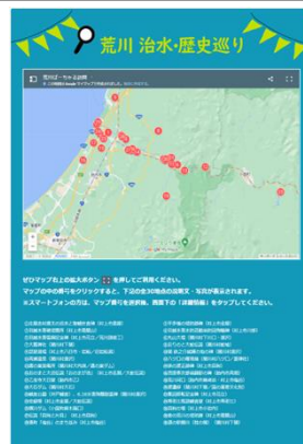
荒川治水・歴史めぐり