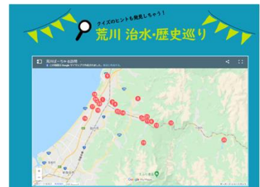
荒川周辺の史跡などの紹介