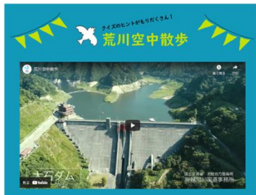
荒川や大石・横川ダムの空中映像