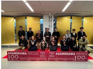
表彰式の様子 (2022年浅野川大橋100周年を 記念したコンテスト)