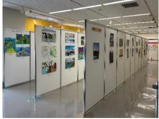
特別展の様子 (2022年浅野川大橋100周年を 記念したコンテスト)