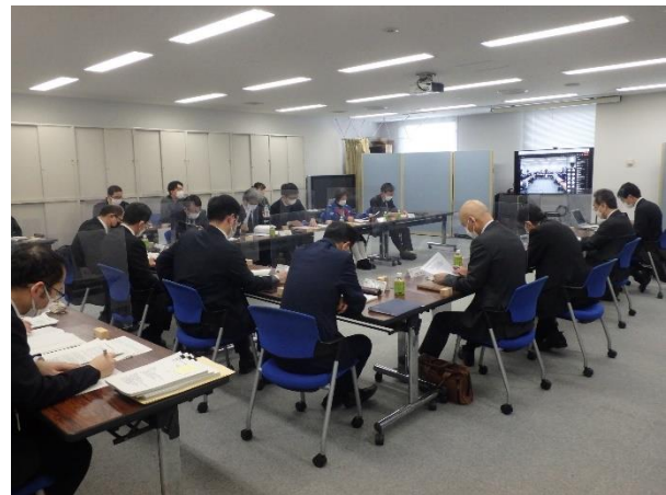
令和4年度 北陸地域港湾の事業継続計画協議会の状況