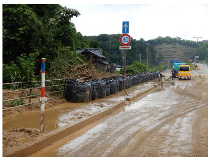
◆R5.7梅雨前線による大雨災害 (津幡町内 土砂撤去・土嚢設置)