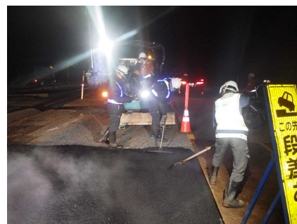
◆R6.1能登半島地震災害 (七尾市内ほか 道路応急復旧)