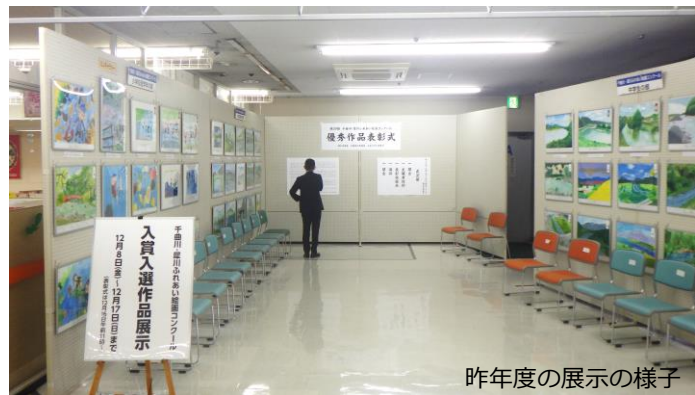
昨年度の展示の様子