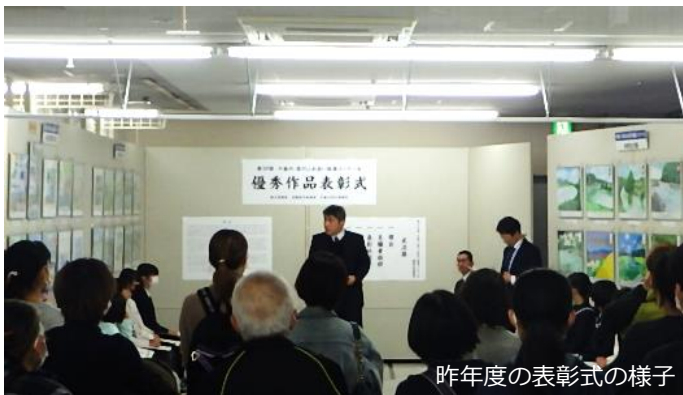
昨年度の表彰式の様子