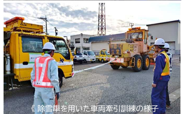
《除雪車を用いた車両牽引訓練の様子》