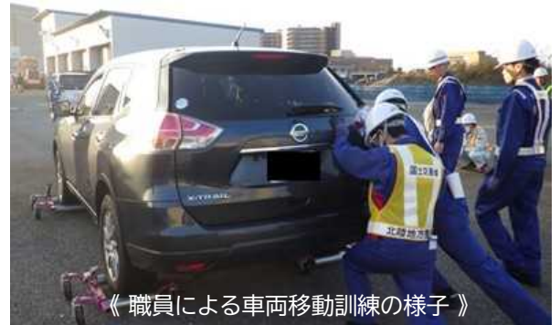
《職員による車両移動訓練の様子》