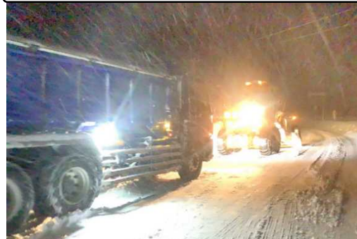
山間部で登坂できない大型車両の様子