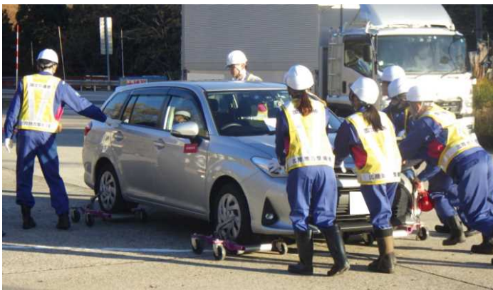
車両移動器具による車両移動訓練の様子