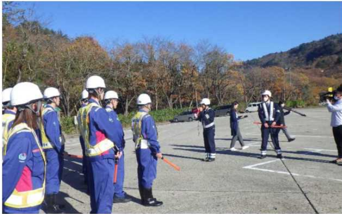
津川署による交通誘導実技指導