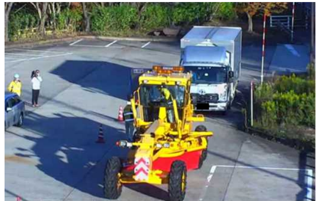
除雪車による車両移動訓練の様子