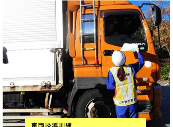
車両誘導訓練 (冬タイヤ装着率調査及び啓発活動)