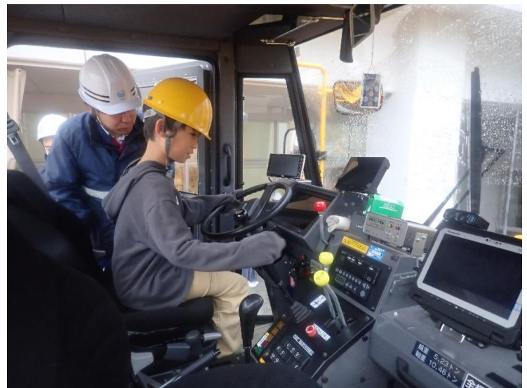
除雪機械への体験乗車