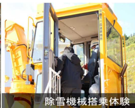
除雪機械搭乗体験