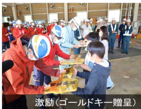
激励(ゴールドキー贈呈)