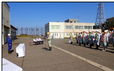
昨年度の除雪出動式