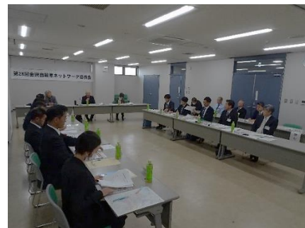
【第28回協議会の様子】

※「第14回金沢自転車ネットワーク形成に向けた勉強会」テーマ ・基調講演：海外での事例報告と金沢での課題 ・パネルディスカッション：クルマ社会の公共交通 ～多様な交通手段の統合と金沢の交通の未来～ 対象者：一般の方、道路管理者等 開催日：11月30日(土)