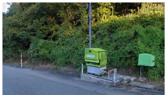
【凍結防止剤散布装置のイメージ】