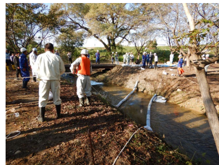
吸着マットの設置訓練