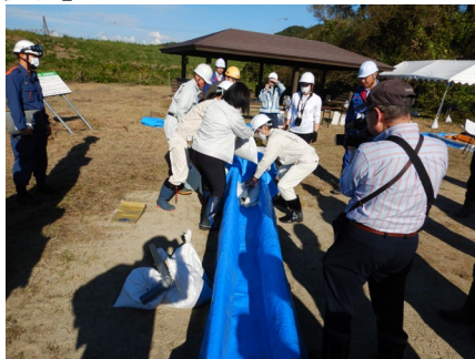
側溝での油回収実験