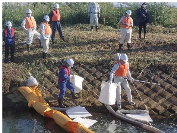
令和5年の様子(オイルフェンス設置訓練)