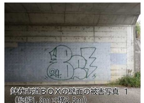
鉢伏市道BOXの壁面の被害写真 1 （約縦1.8m×横2.5m）