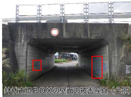
鉢伏市道BOXの壁面の被害写真（全景）