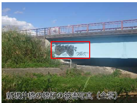
新坂井橋の橋桁の被害写真（全景）