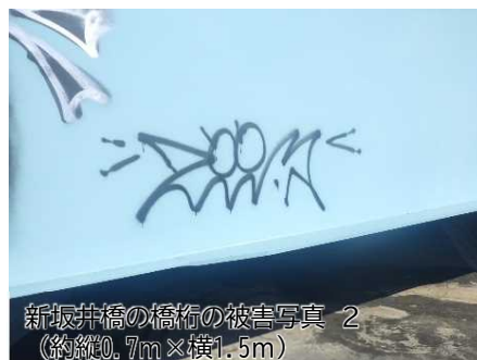
新坂井橋の橋桁の被害写真 2 （約縦0.7m×横1.5m）