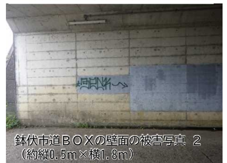
鉢伏市道BOXの壁面の被害写真 2 （約縦0.5m×横1.8m）