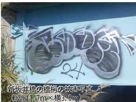
新坂井橋の橋桁の被害写真 1 （約縦1.7m×横3.0m）