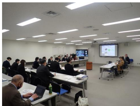
【令和5年度委員会の様子(R6.2.29)】

※傍聴は報道関係者のみとし、撮影は会議冒頭の委員長挨拶までとさせていただきます。