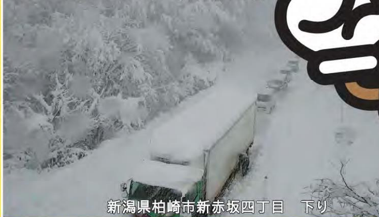
新潟県柏崎市新赤坂四丁目 下り