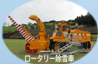
ロータリー除雪車