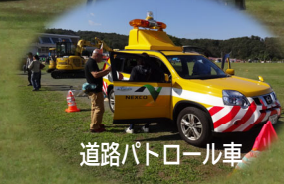
道路パトロール車