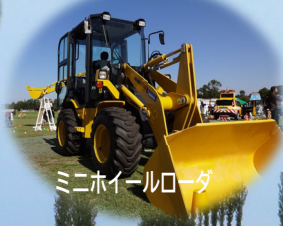
ミニホイールローダ