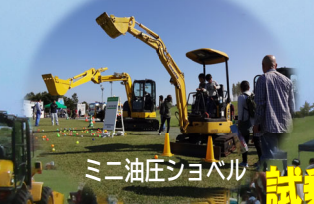
ミニ油圧ショベル