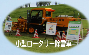
小型ロータリー除雪車