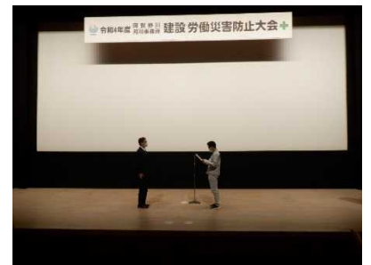
昨年度の大会の実施状況（安全宣言）