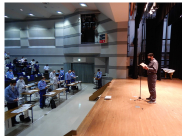
令和4年度大会の様子（写真左：開会挨拶、写真中央：講演、写真右：安全宣言唱和）