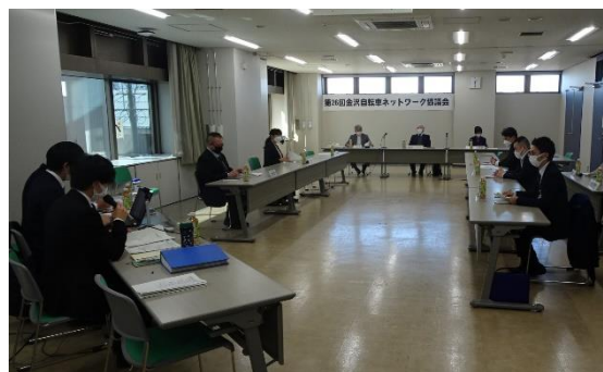
【第26回協議会の様子】

https://www.hrr.mlit.go.jp/kanazawa/douro/bicycle.co/document/news/230606_gaiyou.pdf