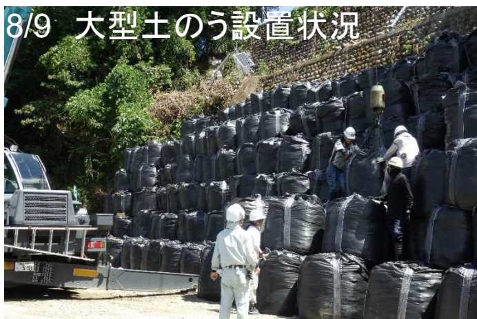
8/9 大型土のう設置状況