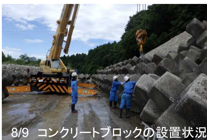
8/9 コンクリートブロックの設置状況