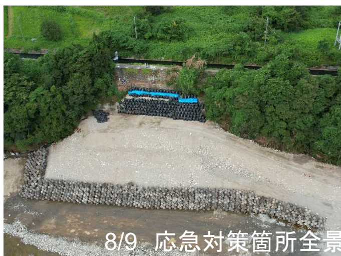
8/9 応急対策箇所全景