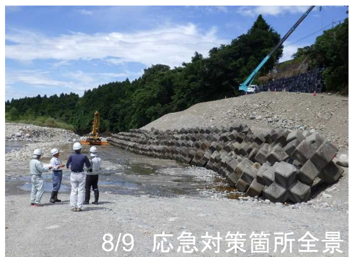
8/9 応急対策箇所全景