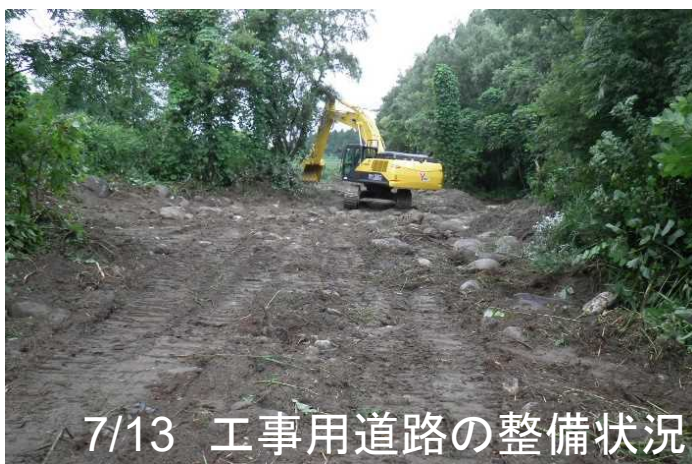
7/13 工事用道路の整備状況